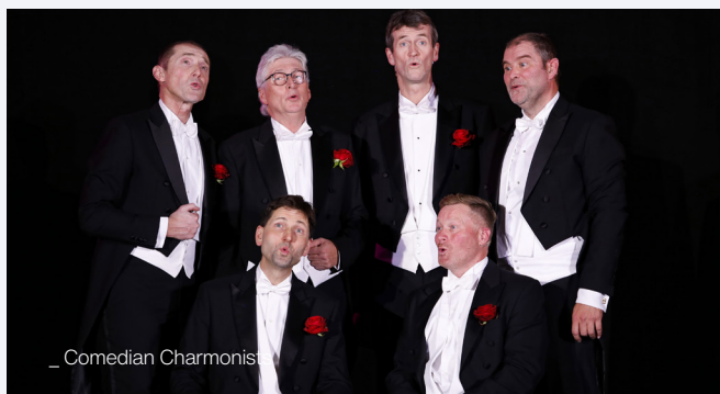
_ Comedian Charmonists

Neue Saison - Neue Lieder: Wieder ziehen die Comedian Charmonists durch die Stadt, im Gepäck ein „Rezept zum Glückhsein“, einen Musicalhit aus „Aladin“, einen echten „Fendrich“, ein Wienerlied und, und, und ... Ihrem Motto „Ein bisschen Leichtsinn“ bleiben die sechs Herren dabei immer treu, und zaubern den Zuhörer:innen ein Lächeln ins Gesicht. Musikalischer Leiter ist Martin Hölzl.