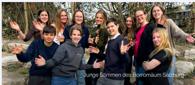
_ Junge Stimmen des Borromäum Salzburg

OFFENE PROBE: MI, 20. MAI, 19.15 UHR, PFARRSAAL MÜLLN