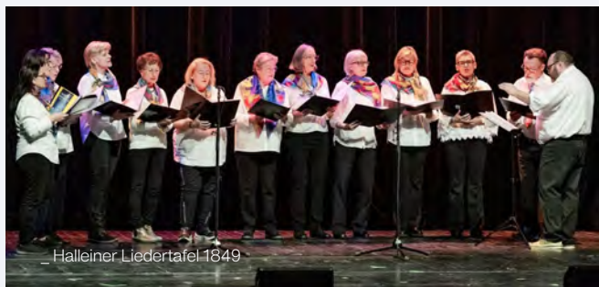
_ Halleiner Liedertafel 1849