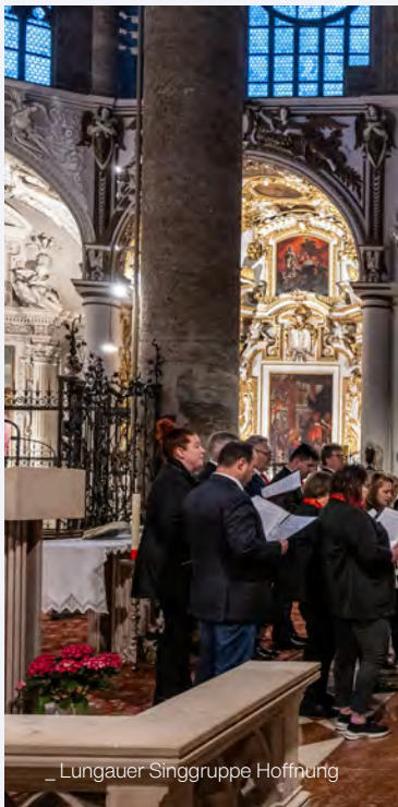
_ Lungauer Singgruppe Hoffnung