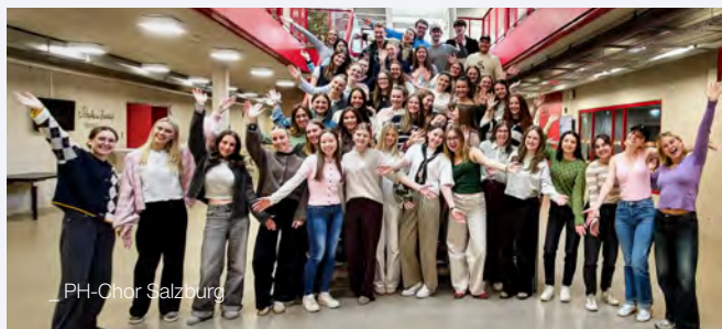
_ PH-Chor Salzburg