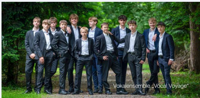
_ Vokalensemble „Vocal Voyage“