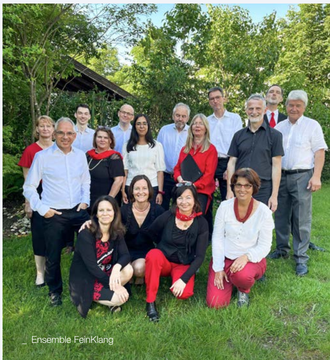
_ Ensemble FeinKlang